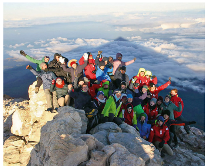
In den ersten fünf Monaten der Reise standen Landausflüge wie hier auf Teneriffa auf dem Programm.

Zur Ankunft in Kiel hatten die 34 Schüler und 14 Besatzungsmitglieder 47 Tage kein Land mehr unter den Füßen gehabt haben, üblicherweise sind es nur 25. Aber Corona verhinderte für die Zehntklässler und ihre fünf Lehrkräfte die geplanten Exkursionen auf den Azoren und eine Stippvisite in Südengland. Selbst einen letzten Sturm musste die „Thor Heyerdahl“ vor den Niederlanden abwettern, ohne dass ein echtes Ausruhen an Land möglich war. Stattdessen Abenteuerausflügen gab es seit den Bermudas Bordalltag. Doch die Schüler aus ganz Deutschland haben die eineinhalbmonatige Enge an Bord des 50 Meter langen Dreimast-Toppsgelschoners gut gemeistert. Und schulisch dürften sie sogar weiter vorangekommen sein als ihre